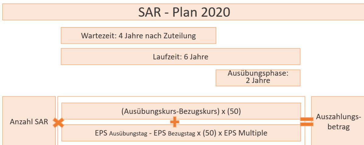
Abb. 4: schematische Darstellung des SAR Plan aus 2020

Die nachfolgende Grafik stellt den SAR Plan überblicksartig vor: